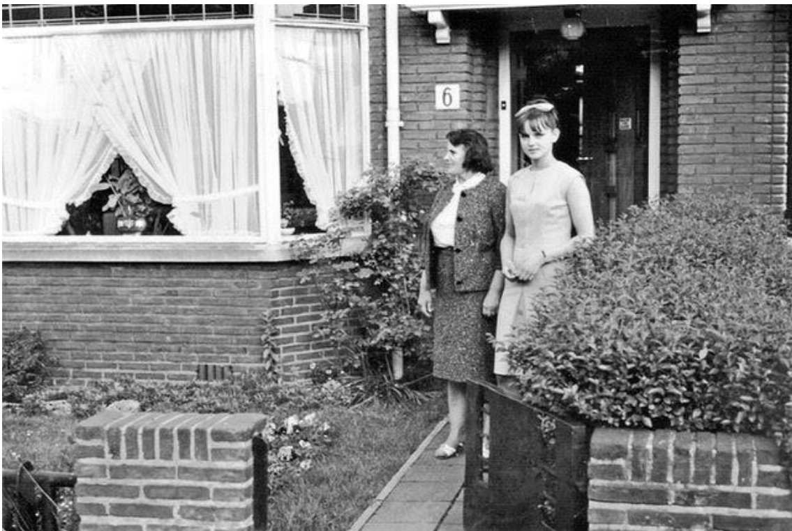
Potgieterlaan 6, Voorburg