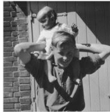
Twee jonge meisjes met en veel oudere broer...