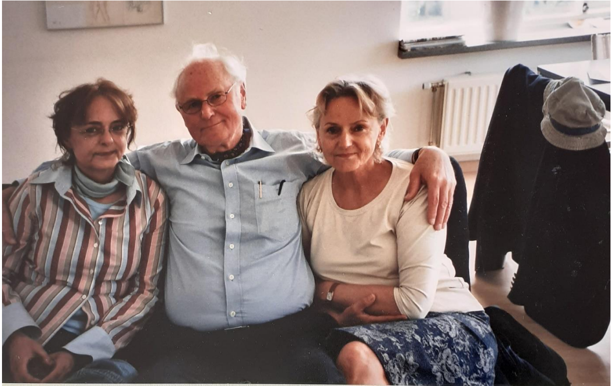
Bronja, Joop en Beatrix op 25 mei 2005